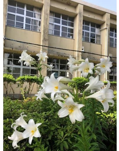
市花「てっぽうゆり」

さて、第2学年は5月17日～19日の日程で鹿児島県内での修学旅行を実施する予定でした。しかし、新型コロナウイルス感染症が広がる傾向にあり、鹿児島県は感染拡大の警戒基準を「ステージⅢ」へ引き上げ、「感染拡大警報」（5月7日～5月23日）を発令しました。今回の修学旅行でも、昨年同様、できる限りの感染予防対策を検討してきました。しかし、2学年生徒129人が集団で一斉に行動する修学旅行では、一般の方と行動を共にすることもあり、島内よりも感染リスクが高まります。また、県内では新型コロナウイルスの感染が急速に拡大しています。